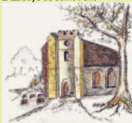
Abbaye de Saint-Pons